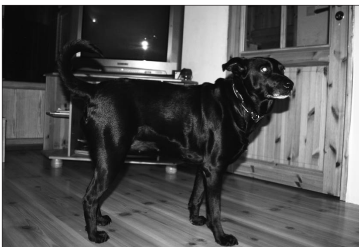
HELDIG: Lissy er en heldig omplasseringshund.